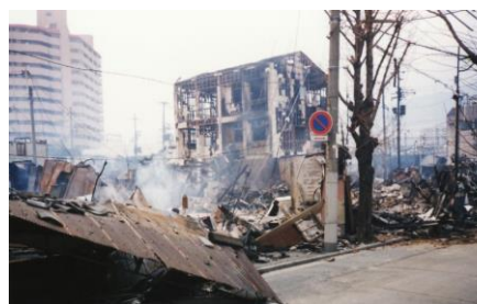
1995年1月阪神・淡路大震災