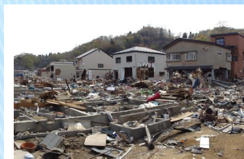
2011年5月岩手県宮古市鞆ヶ崎

◇後援 兵庫県、神戸市、(社福)兵庫県社会福祉協議会、 (社福)神戸市社会福祉協議会、(公財)神戸新聞 厚生事業団、(社福)読売光と愛の事業団